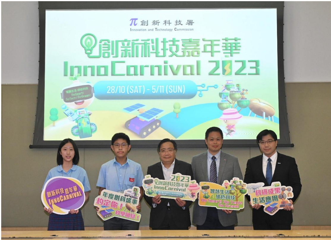
創新科技署署長李國彬今日（九月二十六日）出席「創新科技嘉年華 2023」新聞界預覽。圖示李國彬（中）與參與活動的香港城市大學、香港應用科技研究院及中華基金中學代表合照