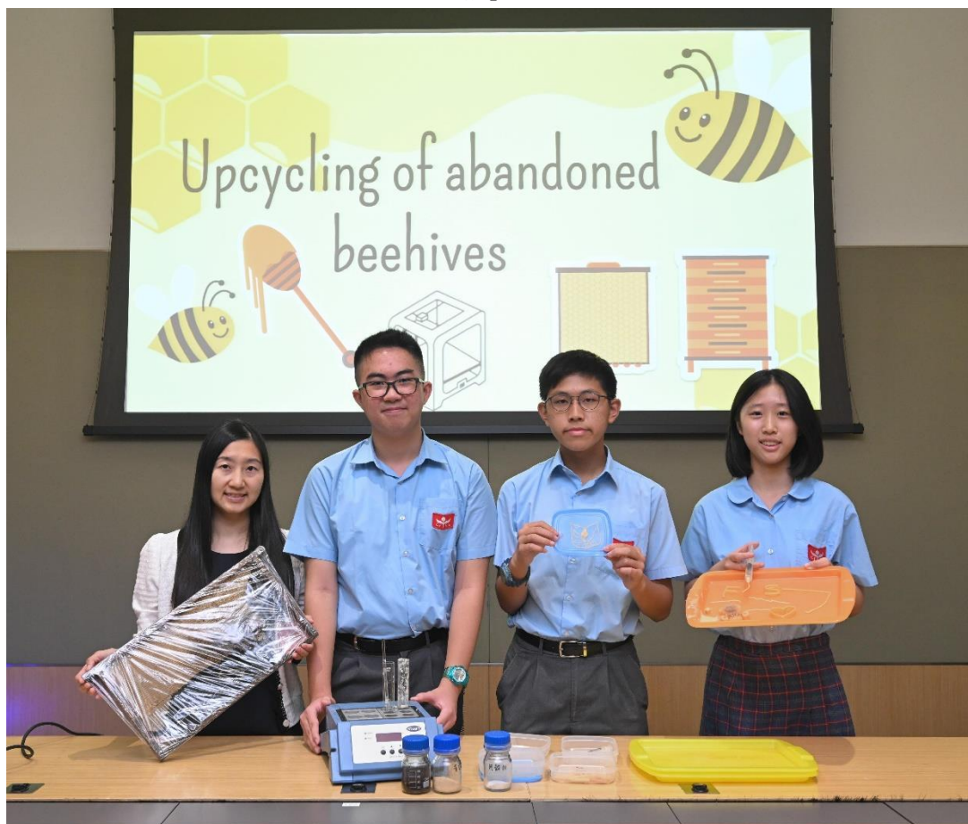
「創新科技嘉年華 2023」將於十月二十八日至十一月五日舉行。圖示中華基金中學學生研發的「走塑•蠟『腳』行動」。