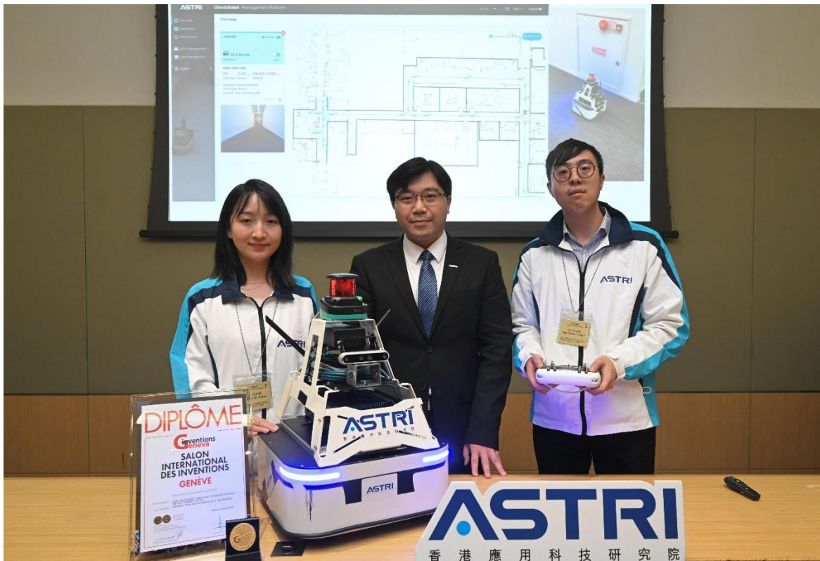
「創新科技嘉年華 2023」將於十月二十八日至十一月五日舉行。圖示香港應用科技研究院的研發項目「5G 雲端機械人系統」。