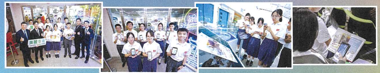
教育局協助安排於全港約500家中學張貼海報及發送內部通訊，學生踴躍參與投票