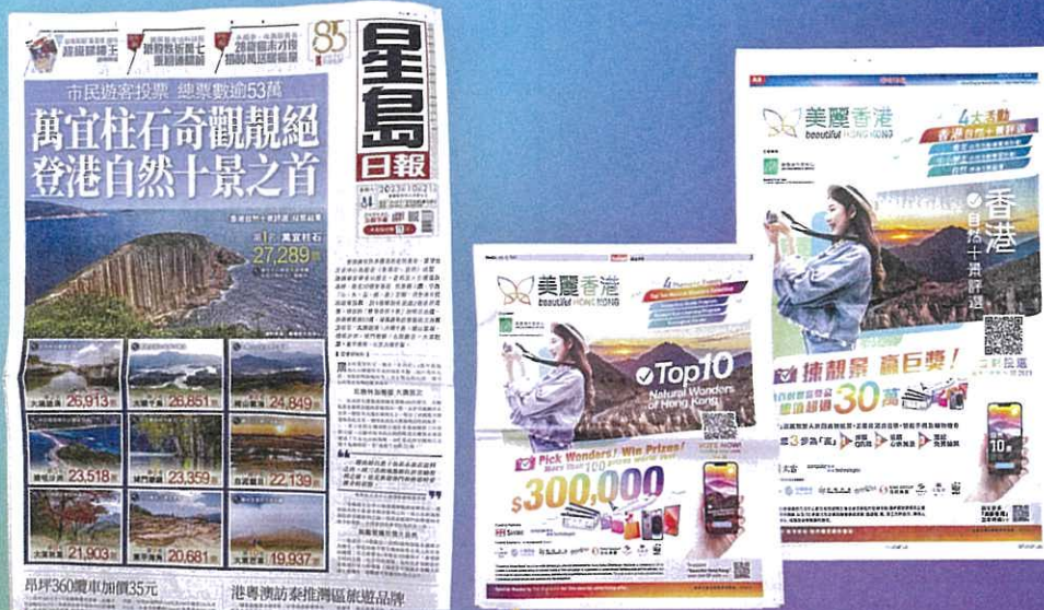
「美麗香港·香港自然十景評選」結果公布，共錄得超過150篇媒體報道，更獲《星島日報》10月21日於頭版頭條刊登全版報道，推廣由全體市民及旅客選出的「香港自然十景」。

第三階段，媒體亦是這次活動的重要推手，除了不遺餘力的報道外，全港9大主要報章提供特別優惠，讓活動廣告得以在報上刊登。中心更結合電視媒體力量，讓活動得以全方位視覺化傳播，例如無綫電視《行行有好景III》播出6期「美麗香港」特別節目；香港電台邀請中心代表做客《凝聚香港》兩期節目進行專訪介紹，並特別在電視頻道內播放中心製作的宣傳短片；此外，中通社透過旗下三大平台共刊登88篇帖文，逐一詳細介紹評選活動三十個候選景點。在合作夥伴眾志成城的支持下，全面提升活動曝光率，讓全港市民都有機會了解及參與活動。