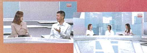
香港電台訪問《香港志》專家並播出2期《凝聚香港》電視節目

第四階段，全面深入民眾，零距離接觸市民大眾及莘莘學子，全力提升社會各界的參與程度。包括：中心於2023書展現場進行投票推廣；地政總署協助於全港地標景點設立街站宣傳；教育局安排於全港約500家中學張貼海報及發送內部通訊，加深年輕一代對香港大自然地質及生態的認識及興趣；「慧妍雅集」先後為評選活動拍攝8條推廣影片，於中心社交媒體平台及香港電台32台播放；中心亦在三個月中，不間斷地透過社交網絡及EDM，向持份者及各界人士宣傳推廣活動。