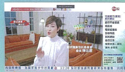
慧妍雅集為活動拍攝8條推廣影片，並於香港電台播放