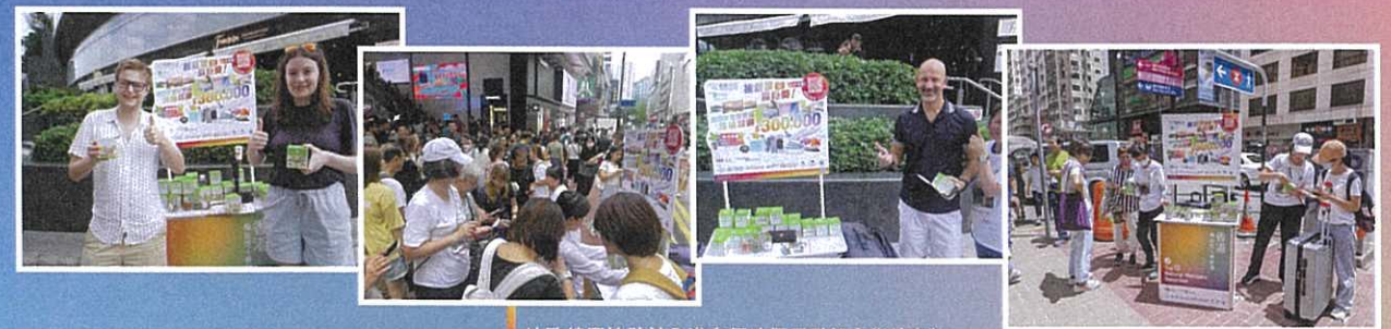
地政總署協助於全港多個地標景點設立街站宣傳

第四階段，全面深入民眾，零距離接觸市民大眾及莘莘學子，全力提升社會各界的參與程度。包括：中心於2023書展現場進行投票推廣；地政總署協助於全港地標景點設立街站宣傳；教育局安排於全港約500家中學張貼海報及發送內部通訊，加深年輕一代對香港大自然地質及生態的認識及興趣；「慧妍雅集」先後為評選活動拍攝8條推廣影片，於中心社交媒體平台及香港電台32台播放；中心亦在三個月中，不間斷地透過社交網絡及EDM，向持份者及各界人士宣傳推廣活動。