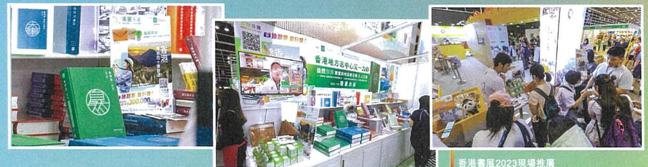
香港書展2023現場推廣