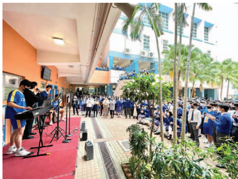
學生一同演繹「逆流之歌」，為全校打氣。