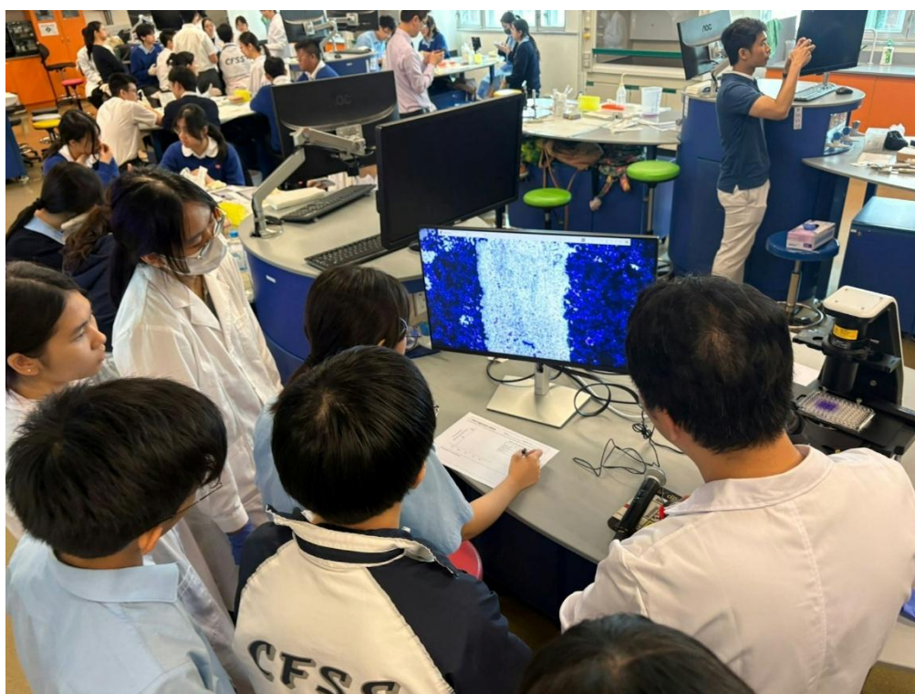
香港浸會大學生物系舉辦「癌細胞資優工作坊」。

癌症研究向來被視為艱深的生物醫學範疇，浸會大學生物系早前透過服務學習模式，讓中學生有機會走進大學實驗室，親身參與癌細胞研究工作，從實踐中認識癌症形成、癌細胞特性及藥物治療原理，從中培養科學思維。