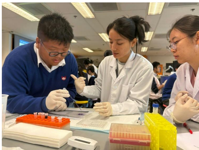
參加學生在浸大團隊指導下，利用數碼顯微鏡觀察癌細胞形態及生長情況。

工作坊以「從課室走進大學實驗室」為主題，內容涵蓋癌細胞生長、癌細胞遷移及組織學研究三大範疇。參加學生在浸大團隊指導下，利用數碼顯微鏡觀察癌細胞形態及生長情況，了解癌細胞異常增生的特徵，並認識癌細胞如何擴散至其他組織，以及藥物抑制癌細胞生長和轉移的機制。