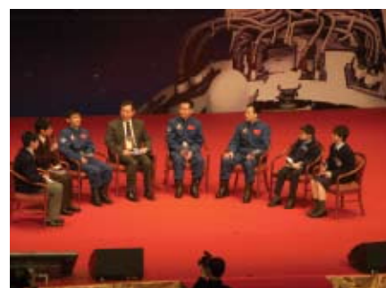
神舟七號載人航天飛行代表團與 學生進行真情對話