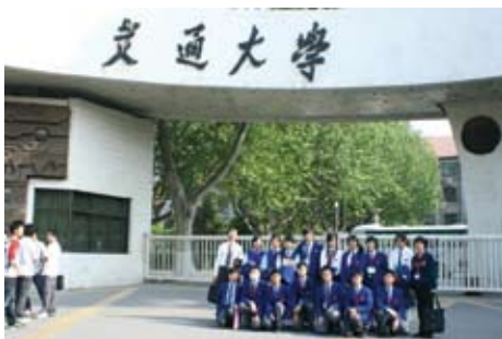
我們在交通大學門口合照

西安交通大學是一所以理工科為主，涵蓋理、工、醫、經、管、文、法等 9 個學科門類的教育部直屬綜合性全國重點大學。該校具有悠久的歷史，人才輩出。學校師資優良，具備國際先進大學水平的校園電腦網、條件良好的現代化學生公寓及學生綜合餐廳、設施先進的體育運動場等。他們的校訓是：「精勤求學，敦篤勵志，果毅力行，忠恕任事」。該校學生很熱情地招待我們，帶我們參觀學校，唱歌給我們聽，大家圍坐在草坪上，相處得很融洽。我們從交流中感受到該校學生讀書風氣很好，待人彬彬有禮，成績優異。該校不愧為中國十大重點大學之一。