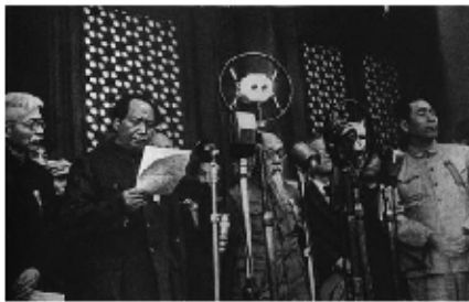
毛主席向世界宣告中華人民共和國成立