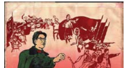
文化大革命時期的宣傳海報「讓毛澤東思想佔領一切文藝舞台」