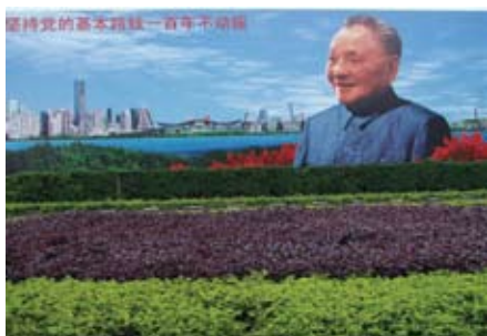
深圳市深南大道上的鄧小平畫像

周：中國從一個弱勢貧窮的國家改變過來，人民基本上生活穩定。現在中國政府需要做的是加強對弱勢社群的保障制度。例如文化水平低、老弱傷殘、有長期病患及住在偏遠地方的那些人。