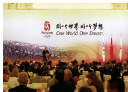
北京奧運口號——「同一個世界，同一個夢想」

周：中國舉辦奧運會的其中一個原因，是希望使北京這個古城變得更加國際化，並引進一些新思維。至於幕後代唱事件，在那個場合中，表演內容的重要性不大，那幕演出只是一種氣氛的營造，故我認為幕後代唱事件的出現不代表中國人民的質素下降。