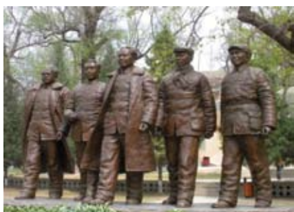
棗園內中央五大書記的塑像

這裡是中共中央領導在 1938 年 11 月至 1947 年 3 月期間的住所，跟在棗園的故居佈置大致相同。當中亦設有圖片館，我們可以從那些圖片中認識更多有關當時革命的情況。在那兒亦看到當年毛澤東與美國記者安娜·路易斯·斯特朗會面時所使用的石桌。該石桌到現在仍保存得非常好，而且亦開放給遊客坐。我們坐在毛主席坐過的石椅上，內心感到很興奮。