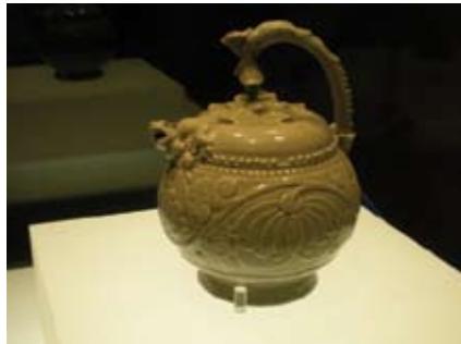
手工精美細緻的倒灌壺