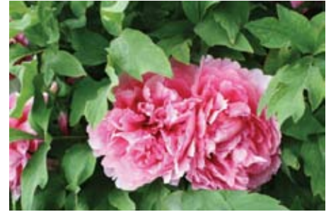
大雁塔公園中盛開的牡丹