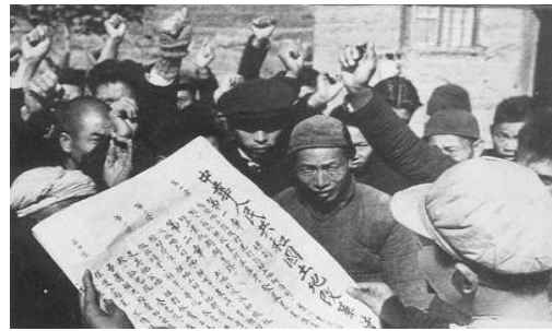
中共公佈《土地改革法》