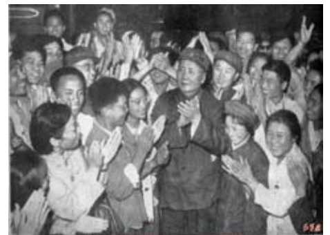
1966年8月18日在天安門城樓與紅衛兵和革命師生在一起