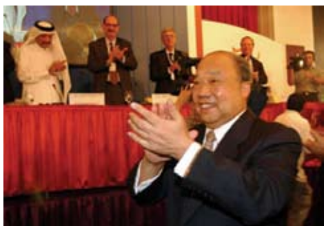
世貿大會一致通過中國加入世貿

曾：中國與香港簽訂《內地與香港關於建立更緊密經貿關係的安排》(CEPA)的好處本是實施零關稅。惟香港的出口總額不大，故此項安排對香港最大的好處是「自由行」的推行，有助香港的服務業在內地發展。其實，兩國之間共同自由貿易開放的協定必須由平等的兩國簽署。不過，香港與中國不是兩國，因此便要簽訂上述協議。