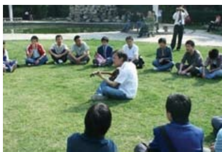
大家在草坪上唱歌