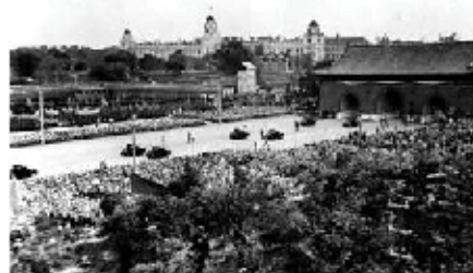
開國大典上的裝甲部隊分列式