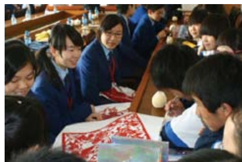
兩地學生交流並互送紀念品