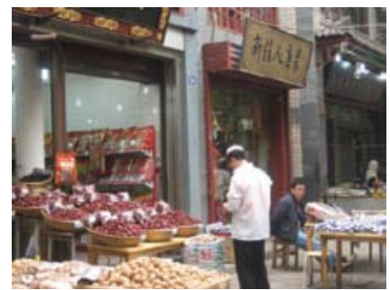
回民街上回族人開設的店鋪