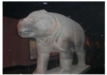
除了石碑，還有一些古代的石刻。多麼雄偉的「石犀」呀！