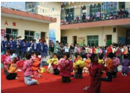
全校師生熱情歡迎我們的到來

蔣路小天使學校位於位於陝西省涇陽縣蔣路鄉，當地的居民多以務農為生，所以當地的生活環境較差、比較落後。該地區擁有八家學校，而這家學校屬民辦私營學校。學校共有三座建築，所謂一座只有一層、只有兩至三間教室而已，最高的那座也僅有兩層。教室四周的牆壁及天花出現剝落的情況，學生要兩個人分享一張殘舊桌子和一條長凳。在與該校師生的交流中，我們可以感受到：雖然環境如此簡陋，但校長的辦學熱情極高，學生也很珍惜這讀書學習的好機會，對於學習條件並沒有任何怨言。