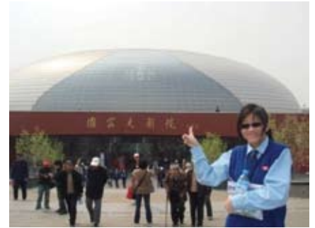
國家大劇院的正門口

4月12日，我們分成兩組，一組前往南韓的首都首爾；另一組則飛往西安。除了參觀西安悠久的歷史文化古蹟以外，為配合今年祖國建國60周年的主題，交流團特別安排了到延安的行程。以下，就讓我們和大家分享一下我們在西安、延安兩地六天之中參觀、交流的所見所聞所感。