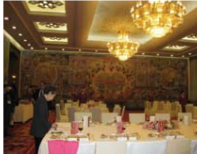
我們在人民大會堂西藏廳午膳