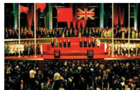
香港主權移交中國之儀式

周：人民以國家文化而自豪是自發的表現，要國家富強才自豪是不應該的。從前國家不開放，資訊不太發達，使香港人對祖國認識不足，便會只想到其壞的方面。因此，若國家更開放，便會產生較大的對流作用，香港人、台灣人有更多機會深入認識提升。