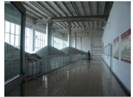
這是金威啤酒廠的發酵工場