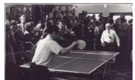
莊則棟與美國乒協主席斯廷霍文切磋球藝

周：又愛又恨。中國人愛美國人的生活模式和物質，如「犀飛利」墨水筆；恨的是1949年之後，共產黨向人民宣稱美國為「美帝」和「侵略者」等。他們認為美國是採取經濟侵略的手段。建交後，中國人對美國更友善，沒有那麼敵對，因為同住一條地球村。