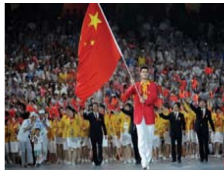
北京奧運會開幕式中國奧運代表團成員進場

曾：中國收回香港的主權是不可避免的。對中國而言，當時最重要的問題是如何最有效益地收回香港的主權，而不是要對台灣進行甚麼示範的作用。