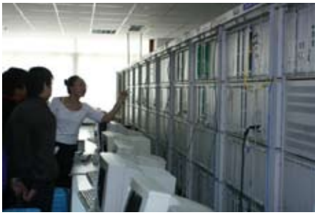
大唐電信的工程師為我們講解