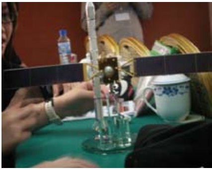
衛星測控中心的工程師為我們帶來的神舟7號的模型