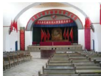
這是楊家嶺中共中央大禮堂