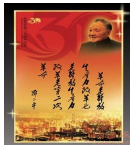
改革開放政策的提出

曾：改革開放最大的阻力或最重要的突破，是「思想解放」。在1949年至1979年間，中國在中共的統治下，實行計劃經濟體系，如成立人民公社。整個領導層和人民都經歷了這個約三十年計劃經濟的思想階段。「思想解放」是改變計劃經濟的關鍵所在。正如鄧小平先生的一句話：不管黑貓或白貓，會捉老鼠的便是好貓。即是要放棄過去沿用的方法（計劃經濟），不管用甚麼方法，以達到改革開放之目的：增加人民的生產力，改善人民的收入。故改革開放最大的阻力是被共產主義的思想所束縛，共產主義所造成的制度僵化。