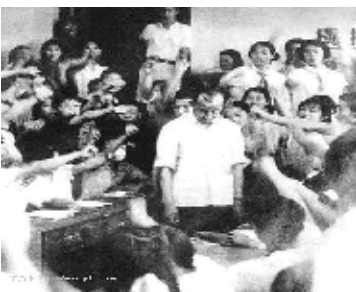
左：文革時學生批鬥老師的場面