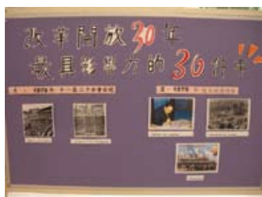
「改革開放三十年最具影響力的 三十件大事」展板