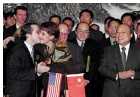
中國與美國談判達成雙邊協定

問：由鄧小平提出要收回香港，以至香港回歸中國的過程中，你有甚麼感受？當時香港不同階層和背景的人士又各有甚麼反應？