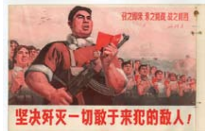
文化大革命時期的宣傳海報「堅決殲滅一切敢於來犯的敵人」

周：文革造成內地人到香港的移民潮，而動盪的香港局勢，令大量的外資企業遷走，房地產也變得便宜。