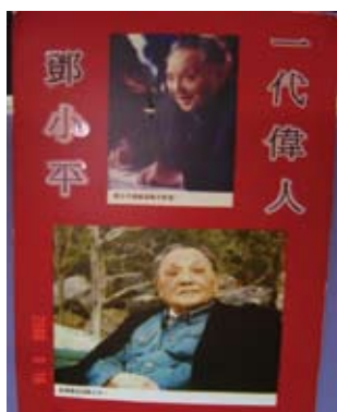
一代偉人—鄧小平先生 偉跡展覽