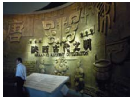
踏入館內便看見：陝西古代文明