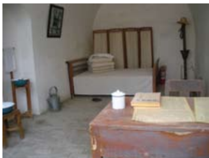
棗園故居內的佈置很簡樸