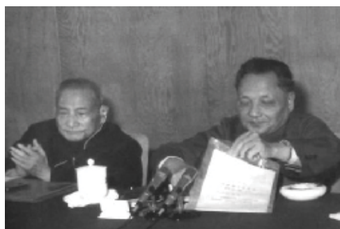
改革開放決策的提出

問：有言即使中國沒有加入世貿，中國的經濟和對外貿易仍然會快速地發展和增長。你同意這個說法嗎？