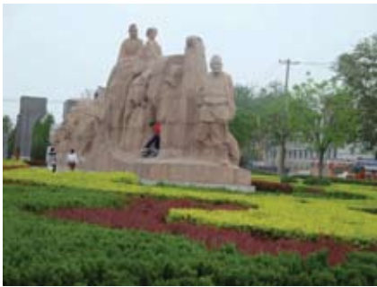
絲路起點：表現當年駱駝商隊遊走 亞歐情景的雕塑

兵馬俑博物館位於秦始皇陵東側約 1.5 公里處，原為秦始皇的兵馬俑陪葬坑。1974 年 3 月時，當地的農民因打井而發現秦俑，後經中國政府有計劃的鑽探與發掘，至今一共挖出了 3 個坑。秦陵兵馬俑是一個聞名中外的名勝古蹟，每個秦俑都造型逼真，五官各異，神態栩栩如生，做工一絲不苟。而且，由秦代至今，不少兵馬俑仍然保存得很好，被譽為世界第八大奇蹟。