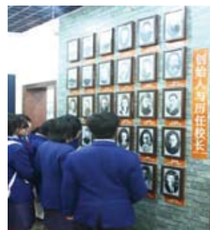
參觀學校的歷史館