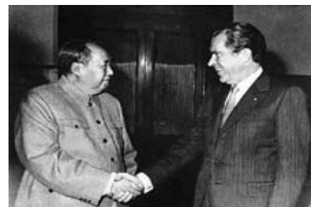
1972年2月，尼克遜總統訪問北京，上海和杭州。同時中美共同簽署上海公報。圖為中共領袖毛澤東會見美國總統尼克遜。

周：這種手段很奇妙，周恩來是一位政治外交的天才。因為他竟然能夠以微不足道的乒乓球來打開中國對外的大門，有創意又令人出人意表，還載譽歸來，促使中美建立。如果一定要以其他外交手段取代，或可以以女子排球或中國武術取代。