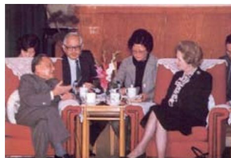
鄧小平會見英國首相戴卓爾夫人

曾：八十年代，中國提出要收回香港，引發移民潮出現。在八十年代末至九十年代初，每年約有六萬人移民到澳洲、加拿大等地，佔香港當時總人口的百分之一。至於沒有移民的人主要是由於「貧賤不能移」，即是缺乏經濟能力而不能移民到外地。那些因貧窮而不能移民的人便要接受香港回歸中國的事實，他們往往會感到恐懼，因而產生了推行民主政制的訴求，要求以民主抗衡共產。然而，當中國經濟情況好轉，政治加強開放，人們的擔憂逐漸減少，移民往外國的人數也減少。