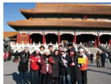
攝於故宮三大殿的正門— 太和門前