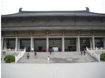
富有中國建築特色的陝西博物館

陝西博物館的建築富有中國特色，整個博物館包括數個展館，展出了不同朝代如秦、漢、唐等的歷史文物。當中每一件展品都令我們大開眼界，畢生難忘。例如展現出古人智慧和技藝的倒灌壺、展現古人環保意識的彩繪雁魚銅燈、展現古人生活模式的青銅用具，那些文物都非常精巧，均令我們驚歎古人的智慧和技藝。由於時間所限，我們無法欣賞每件展品，確有點遺憾。