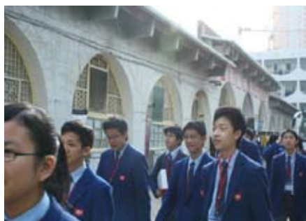
這排窯洞式的建築為老師宿舍

他們為我們表演當地民歌，還準備了搖鼓表演，配合舞蹈，非常精彩。交流後，我們發覺該校學生對學習的態度都非常認真，有一種堅持不懈的精神。