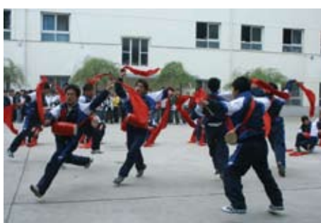
當地學生表演精彩的腰鼓舞