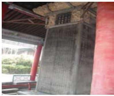
碑林博物館內豎立的中唐虞世南的《孔子廟堂碑》