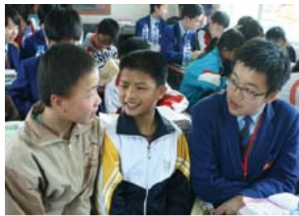
兩地學生熱烈交流