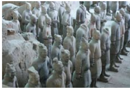
兵馬俑坑是秦始皇陵的陪葬坑之一， 象徵秦始皇的無敵大軍