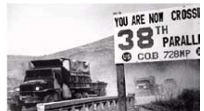
10月7日，美軍開始越過三八線，進入北朝鮮

周：中國出兵的決定是正確的，因為當時負責帶領美軍打這場戰爭的將軍麥克阿瑟在自傳中曾提及他們準備渡過鴨綠江，即準備入侵中國的意思。加上美國朝野有一些政治人物也向杜魯門總統主張應趁中國強大時消滅她，故中國派出志願軍是在所難免的。